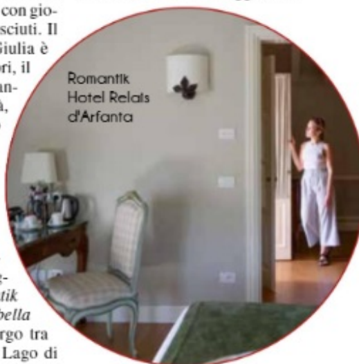
Romantik Hotel Relais d'Arfanta

Le case porticate con facciate affrescate si riflettono sul canale dei Buranelli ed è un incanto passeggiare tra Piazza dei Signori con i suoi palazzi storici, il Duomo e scoprire mostre d'arte. Per il soggiorno,