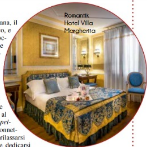
Romantik Hotel Villa Margherita

• Tel. 328-59.86.170, www.borgocampello.com