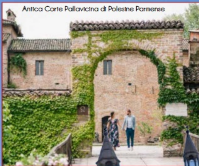
Antica Corte Pallavicina di Polesine Parmense

l'Antica Corte Pallavicina di Polesine Parmense (PR), castello trecentesco vicino al fiume Po che ospita le cantine di stagionatura del Culatello più antiche al mondo e cuore della cucina gastrofluviale dello Chef Massimo Spigaroli.