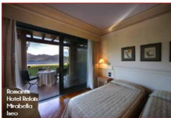
Romantik Hotel Relais Mirabella Iseo

Sognante, raffinata, misteriosa. Non esiste una città d'arte come Venezia. Passeggiare o navigare tra i caratteristici