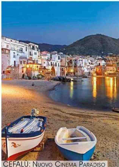
CEFALU: NUOVO CINEMA PARADISO

entrati nell'immaginario collettivo grazie ad alcune scene memorabili di Nuovo Cinema Paradiso , di Giuseppe Tornatore (1988): Polifemo e Ulisse sul telo del cinema all'aperto, i ragazzi che guardano il film in piedi sulle barche ormeggiate, il temporale che interrompe la magia della proiezione. A un'ora di strada, ecco Palermo: Wim Wenders ha ambientato Palermo Shooting (2008) tra le catacombe dei cappuccini, il mercato della Vucciria, i Quattro Canti, i palazzi Butera e Abatellis. Emma Dante ha girato sulla spiaggia di Mondello le scene clou de Le sorelle Malcaluso (2020).