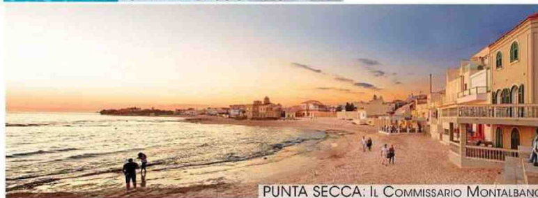
PUNTA SECCA: IL COMMISSARIO MONTALBANO

L cinema, certo, ma anche le serie tv: sono sempre più spesso la fonte d'ispirazione per i viaggi che sogniamo e mettiamo in agenda per le nostre vacanze. Si chiama streaming travel , ed è il desiderio di visitare, anzi, vivere di persona i set delle nostre fiction preferite. Secondo il Rapporto globale sull'affinità culturale e il turismo sullo schermo, curato nel 2021 da Netflix, uno dei principali operatori di streaming, e dall'Organizzazione mondiale del turismo (Unwto), lo screen-tourism , il "turismo da schermo" che insegue set e località immortalate da film e serie tv, è una delle tendenze di viaggio principali. Una fruizione che crea, secondo gli esperti di media, un rapporto più diretto tra spettatori e personaggi delle fiction e suscita, appunto, il desiderio di visitare i luoghi rappresentati.